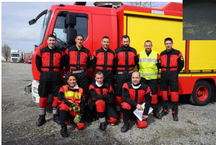
L'équipe secours routier du SDIS 44